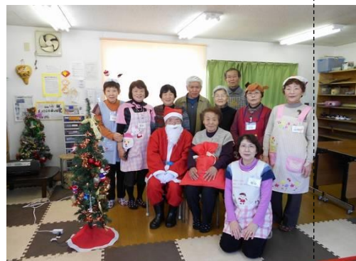
昨年のクリスマスパーティーにて！